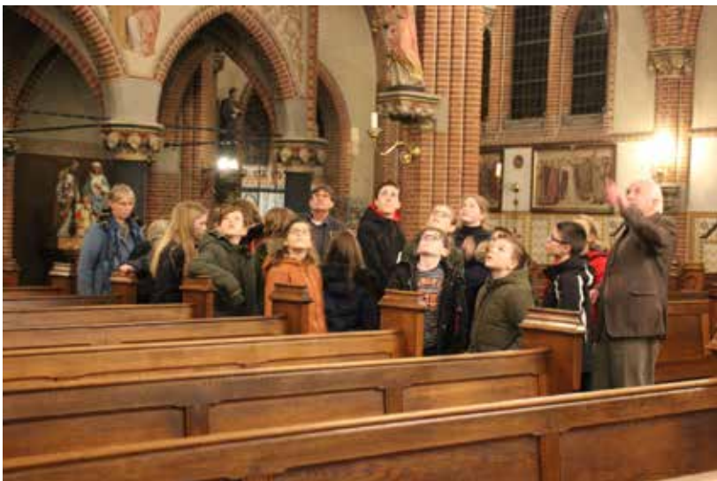
Vormelingen krijgen uitleg over de beelden aan de pilaren van de Corneliuskerk

Op 8 januari, tijdens de 'kerkentocht', was er voor de kinderen een excursie in onze eigen Corneliuskerk en in de Protestantse kerk van Beuningen. De avond begon met stemmige muziek in een warme en sfeervol verlichte Corneliuskerk. Aan de kinderen werd uitgelegd wat er allemaal te zien is in onze kerk en wat de beelden, schilderijen en symbolen voor een betekenis hebben.