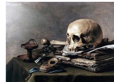
Vanitas , 1630, Pieter Claesz. Thema: Memento mori is een Latijnse zin die traditioneel wordt vertaald als Gedenk te sterven of Denk eraan te [moeten] sterven.

The rain falls on the just And on the unjust fella; But mainly upon the just, Because the unjust has the just's umbrella.