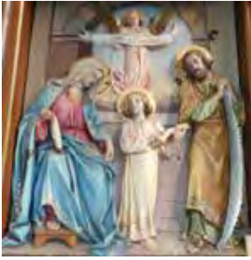
Foto: Detail uit het Jozefaltaar Andreaskerk te Weurt

Toen de sabbat was aangebroken, gaf Hij onderricht in de synagoge, en vele toehoorders waren stomverbaasd en zeiden: 'Waar haalt Hij dat allemaal vandaan? Wat is dat voor wijsheid die Hem gegeven is? En dan die wonderen die zijn handen tot stand brengen. Hij is toch die timmerman, de zoon van Maria en de broer van Jakobus en Joses en Judas en Simon? En wonen zijn zusters niet hier bij ons?' En ze namen aanstoot aan Hem' (Mc. 6:2-3; zie ook Mt. 13:54-57).