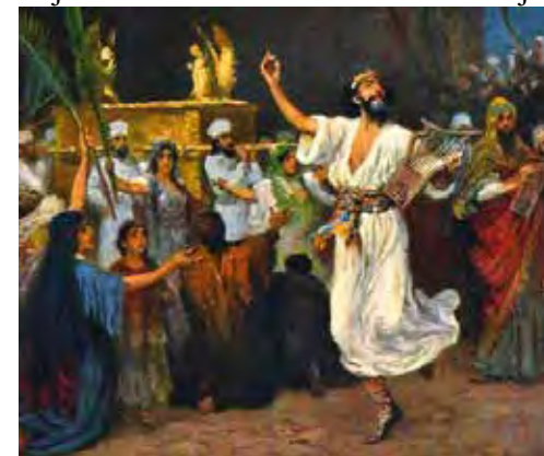
Een dansende koning

"Geen enkele christelijke ritus kent de dans" zei emeritus-paus Benedictus XVI in 2000 toen hij nog kardinaal Ratzinger was. Hij zag in de dans geen uitdrukkingmogelijkheid voor de christelijke liturgie. Velen waren hem in deze opvatting voorgedaan. In de dans worden gevoelens en gedachten uitgedrukt door middel van het lichaam. Daarbij is de kans groot dat men niet alleen genoeg scheidt in de dans zelf, maar ook genot ervaart in lichamelijke schoonheid en de seksuele aantrekkelijkheid ervan. Naarmate de christelijke religie zich ontwikkelde tot een godsdienst van het Woord, kwamen de begrippen lichaam, genot en lust in een steeds kwader daglicht te staan. Tenslotte werd het lichaam beschouwd als een bron van zonde en zelfs het bekijken van het eigen lichaam werd verboden. In 743 kwam er