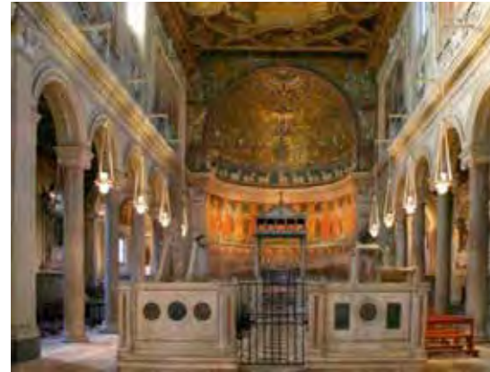
De San Clemente in Rome

Uit andere apocriefe boeken maar ook uit geschriften van de kerkvaders blijkt dat dansen in de eerste eeuwen van onze jaartelling in de vroege kerk werd gepraktiseerd op een tamelijk prominente manier. Voor sommige groepen was een dansende Jezus blijkbaar niet vreemd, abnormaal of ontoelaatbaar. In beschrijvingen van de oudste vormen van christelijke liturgie is de dans zelfs in de liturgie opgenomen. Zowel Justinus de Martelaar als Hippolytus beschrijven rond 200 n. Chr. vreugdevolle cirkeldansen. Clemens van Alexandrië, een belangrijke kerkvader tussen 150 en 215 n. Chr., schreef dat de christelijke cirkeldans het lichaam van Christus als kerk symboliseerde. Hij