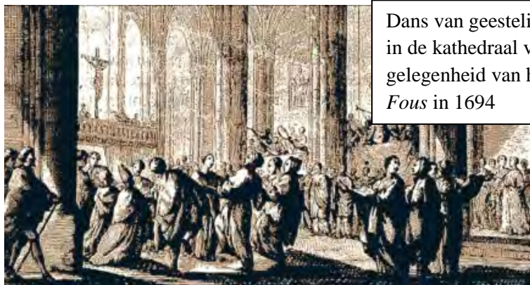
Dans van geestelijken en leken in de kathedraal van Nîmes bij gelegenheid van het Fête des Fous in 1694

Kortom, door terug te grijpen op deze oude liturgische vormen, hebben we helemaal geen behoefte aan liturgische vernieuwing. En natuurlijk zeg ik dat met een ironische ondertoon.